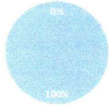
Pessoas Atendidas - Sexo